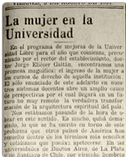
Imagen 6: La mujer en la Universidad.