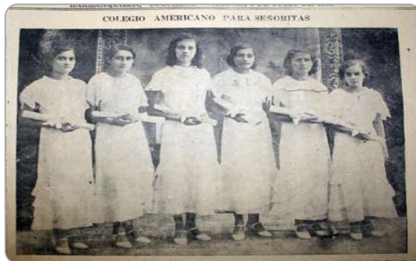
Imagen 1: Colegio Americano para señoritas.