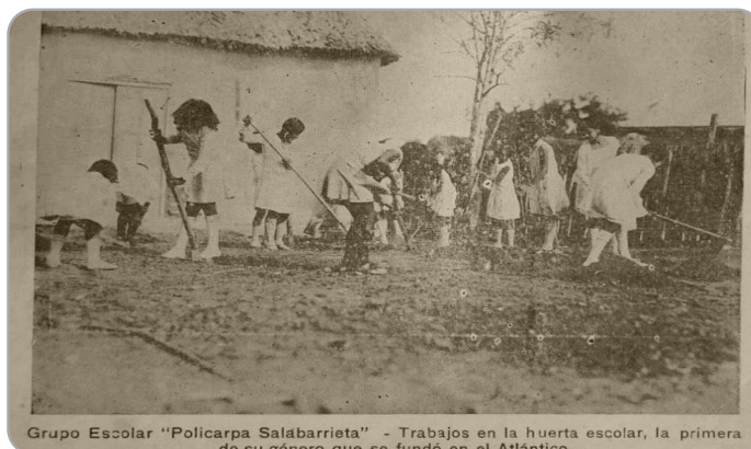
Imagen 4: Grupo escolar Policarpa Salavarieta “trabajo en la huerta escolar, la primera de su género que se fundó en el Atlántico.