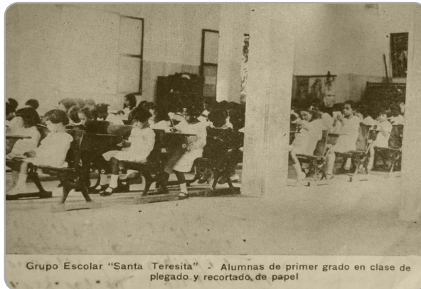
Imagen 3: Grupo escolar “Santa Teresita”. Alumnas de primer grado en clase de plegado y recortado de papel.