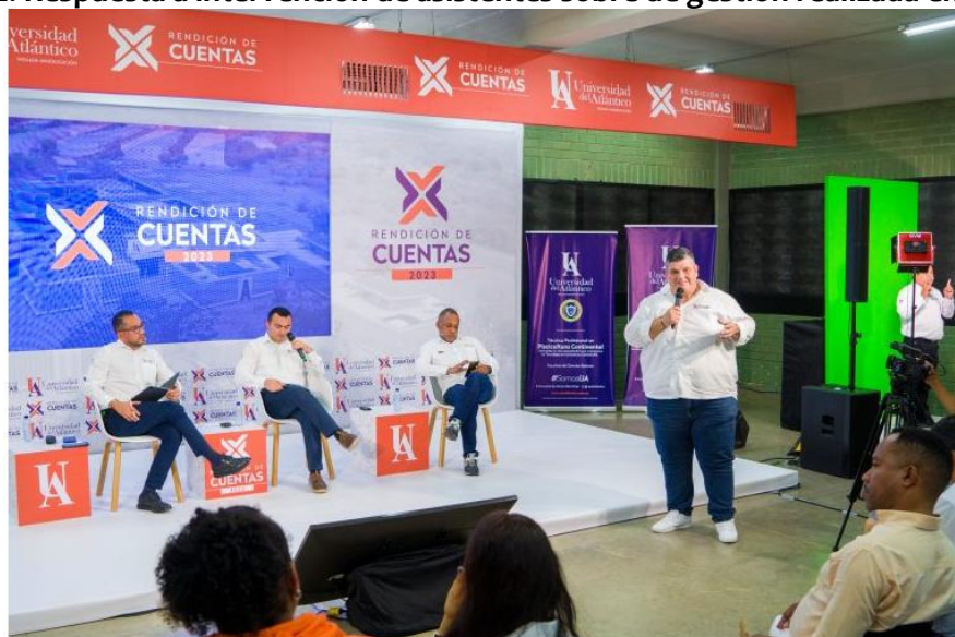
Fotografía 2. Respuesta a intervención de asistentes sobre de gestión realizada en 2023.

La tabla anterior, permite visualizar las temáticas de mayor interés por parte de la comunidad, siendo Línea 4, Bienestar Universitario, Salud mental positiva, Inclusión y Democracia con mayores solicitudes recibidas.