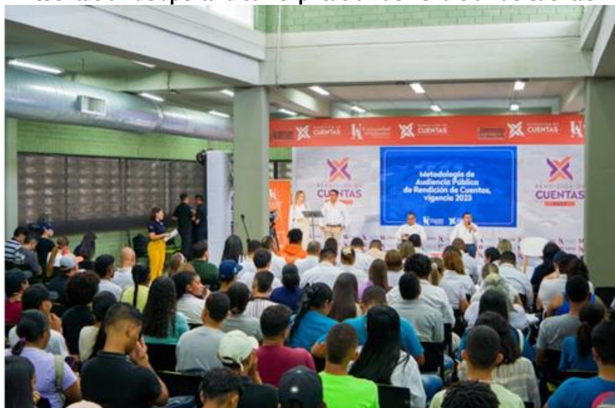
Fotografía 1. Presentación de apertura con explicación de Rendición de Cuentas.

Con respecto a la asistencia mediante canales virtuales, se alcanzó la participación de 305 vistas en el canal YouTube durante la transmisión en vivo y, en la red social de Facebook 2.500 vistas , 22 comentarios y 39 reacciones.